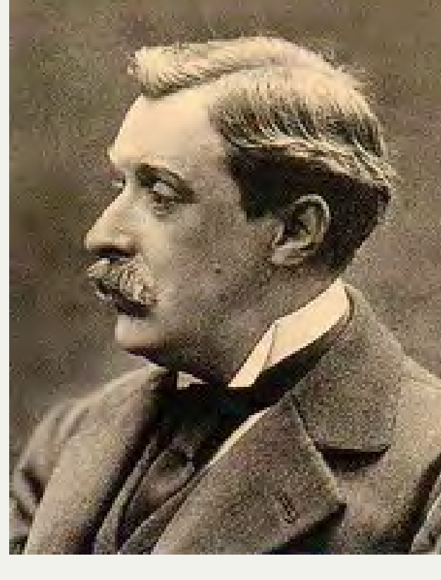
CHARLES-ALPHONSE ALLAIS (1854-1905)