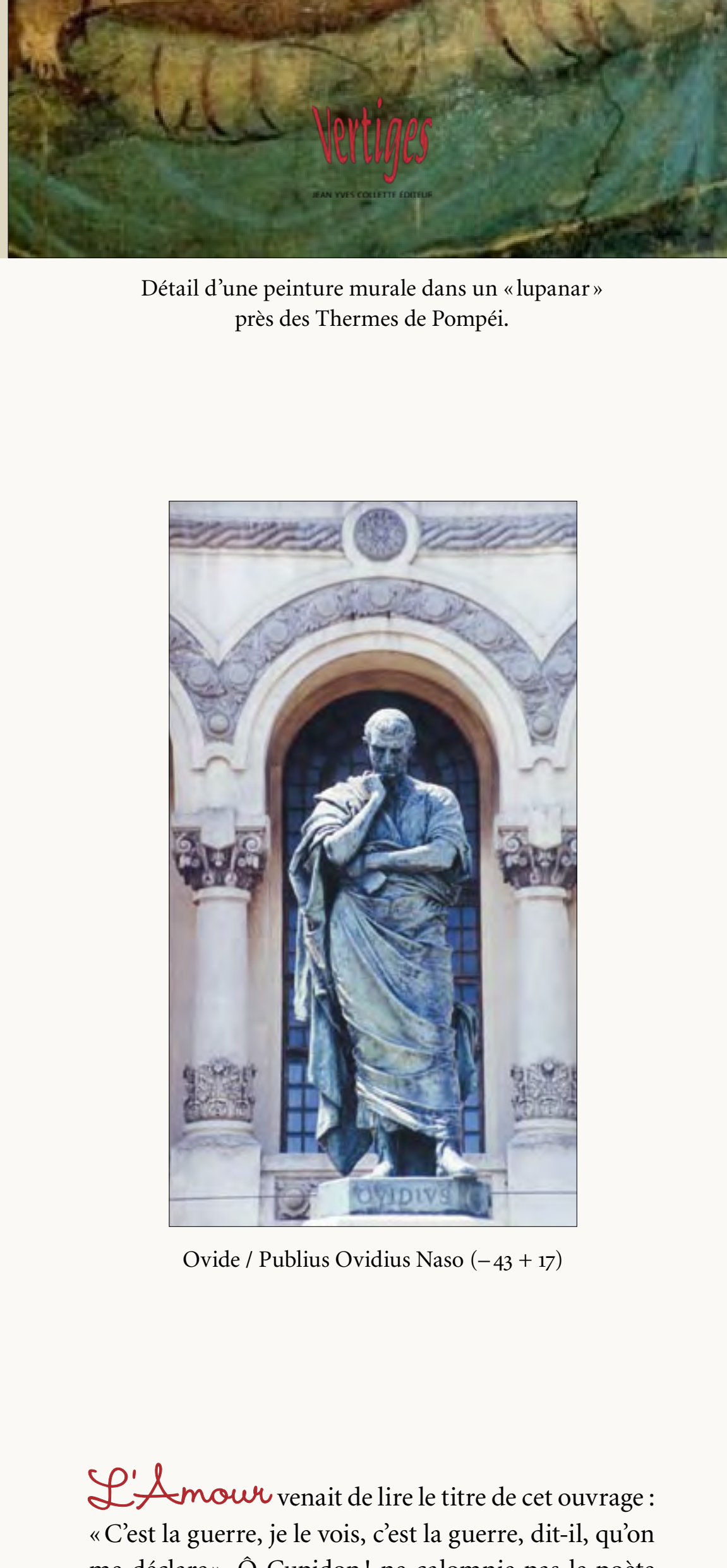
Détail d'une peinture murale dans un «Lupanar» près des Thermes de Pompéi.